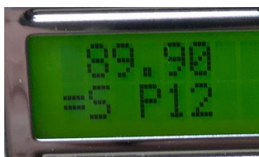
Taste „ENTER“ . Damit ist 89,90 MHz auf Taste 12 gelegt, fertig.