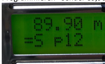
Taste „MEM“, Taste 12 ---- kleines „m“ in erster Zeile

Programmieren Sender 89,90MHz auf Taste 12 legen.