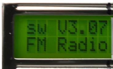
Software Version beim Einschalten