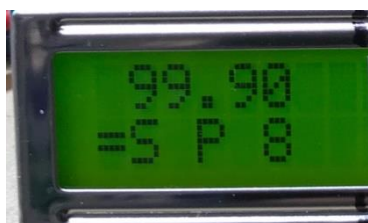
Abgestimmt auf 99,90Mhz, Stereo, Taste 8

Programmieren Sender 89,90MHz auf Taste 12 legen.